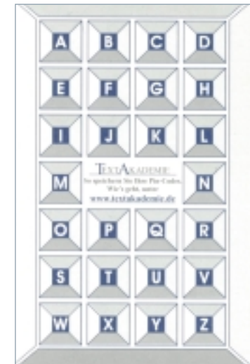
Abb. 3: Ergebnis der Kreativitätssitzung der Textakademie mit Hilfe der Osborn-Checkliste: die Rückseite der Unternehmens-Visitenkarte mit dem Pincodes-Muster.

Eine Gutschein-Visitenkarte konnten wir uns zwar gut vorstellen. Am besten gefiel uns aber die Pincodes-Karte. Inzwischen schmückt die Rückseite jeder unserer Visitenkarten (s. Abb. 3 oben) eine solche Merkhilfe. Mit dem nun geschützten Verfahren lassen sich mit einem persönlichen Passwort vier Zahlenkombinationen auf einmal kodieren. Ohne das Kennwort stellt die Karte aber für jeden anderen einen undurchschaubaren Zahlensalat dar. Ihre